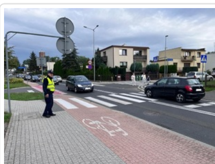
Działania pn. "Bezpieczna droga do szkoły". Nietrzeźwi kierujący wyeliminowani z ruchu drogowego.