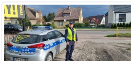
Działania pn. "Bezpieczna droga do szkoły". Nietrzeźwi kierujący wyeliminowani z ruchu drogowego.