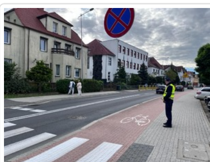
Działania pn. "Bezpieczna droga do szkoły". Nietrzeźwi kierujący wyeliminowani z ruchu drogowego.