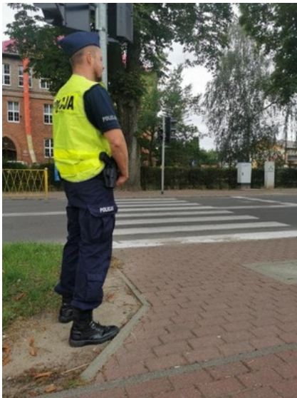
Działania pn. "Bezpieczna droga do szkoły". Nietrzeźwi kierujący wyeliminowani z ruchu drogowego.