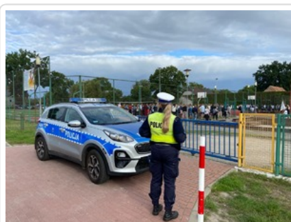
Działania pn. "Bezpieczna droga do szkoły". Nietrzeźwi kierujący wyeliminowani z ruchu drogowego.