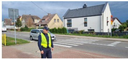
Działania pn. "Bezpieczna droga do szkoły". Nietrzeźwi kierujący wyeliminowani z ruchu drogowego.