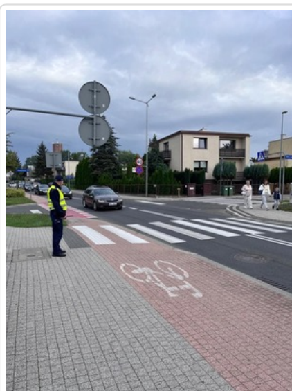
Działania pn. "Bezpieczna droga do szkoły". Nietrzeźwi kierujący wyeliminowani z ruchu drogowego.