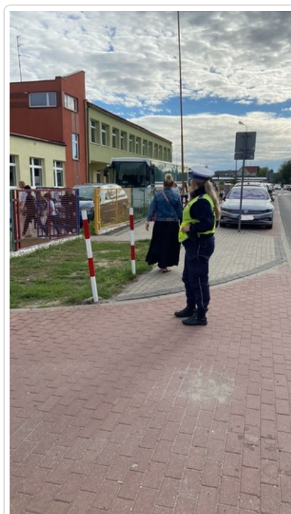
Działania pn. "Bezpieczna droga do szkoły". Nietrzeźwi kierujący wyeliminowani z ruchu drogowego.