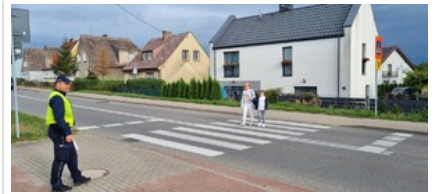
Działania pn. "Bezpieczna droga do szkoły". Nietrzeźwi kierujący wyeliminowani z ruchu drogowego.